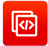
增强型 AT 命令集